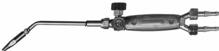
Рис.1- Общий вид горелки

Горелка состоит из ствола и комплекта наконечников. Ствол горелки имеет регулировочные вентили кислорода и пропан-бутана. К стволу по резиновым рукавам